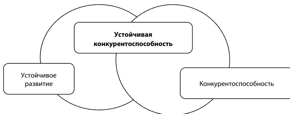
Рис. 1. Ключевые компоненты устойчивой конкурентоспособности