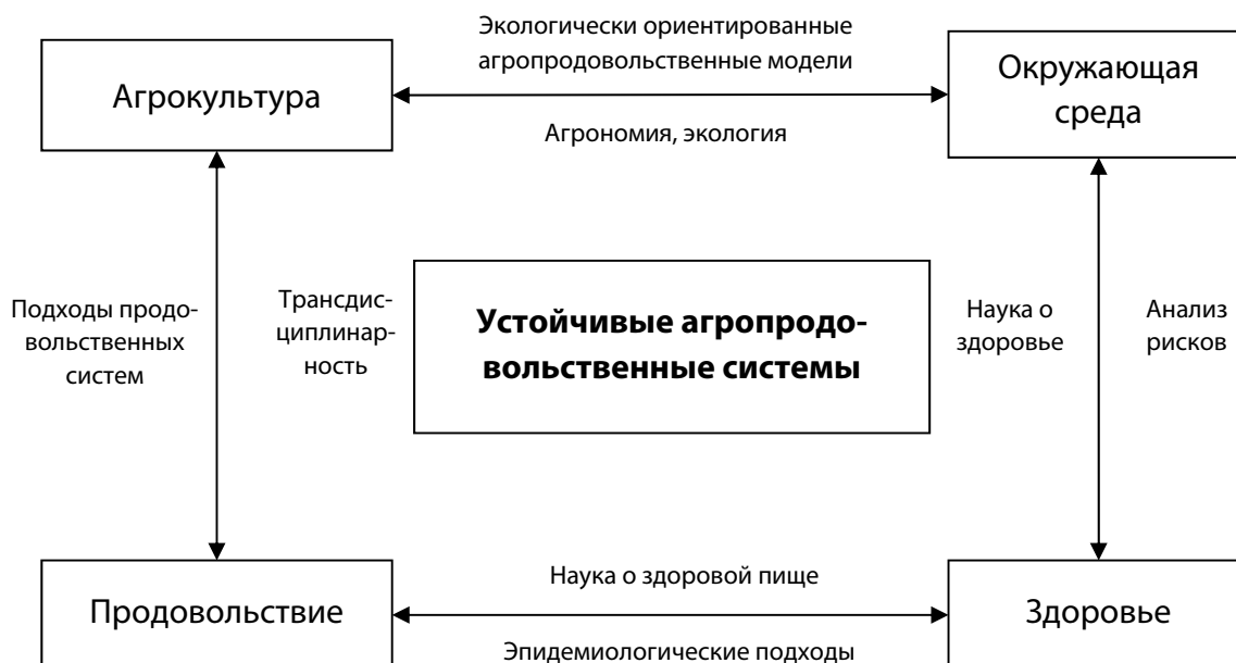
Рис. 3. Сущность и структура современных региональных агропродовольственных систем [131]