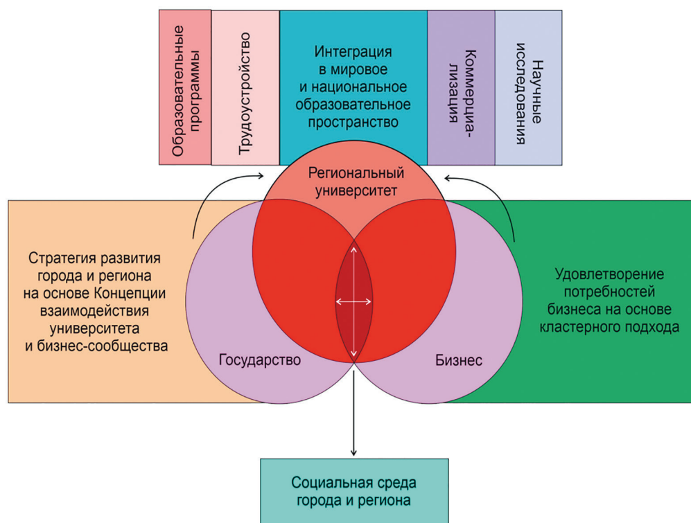
Рис. 2. Модель тройной спирали с главенствующей ролью университета: региональный аспект

Региональная специфика такой модели заключается в том, что в ней роль центра инновационной региональной системы объективно отведена Жезказганскому университету, являющемуся монополистом в сфере научных исследований в регионе. Действие модели предполагается также в условиях одной технологически передовой отрасли — горно-металлургической, что, с одной стороны, является негативным последствием моноотраслевой специализации депрессивного региона, а с другой — позволит быстрее ослабить степень депрессии из-за высокой степени концентрации сил внутри модели. Эти факторы обуславливают ее объективную актуальность.