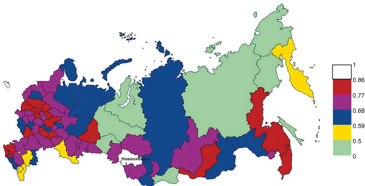
Рис. 4. Карта типологии структурно-технологической близости субъектов РФ для Новосибирской области, 2016 г.