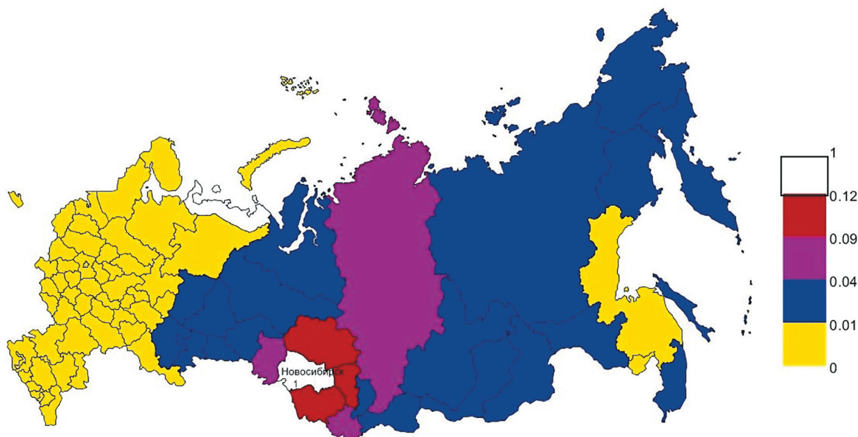
Рис.2. Карта типологии географической близости субъектов РФ к Новосибирской области, 2016 г.

Fig. 2. Typology map of the geographical proximity of the constituent entities of the Russian Federation to the Novosibirsk region, 2016