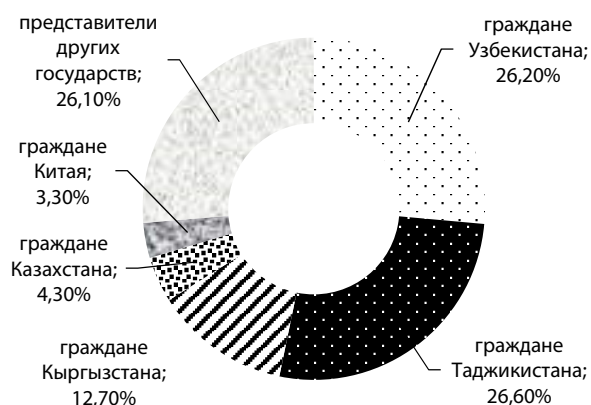
Рис. 3. Соотношение представителей государств, формирующих миграционные потоки на территорию Свердловской области в 2014 г.

на территорию Свердловской области, представлено на рисунке 3.