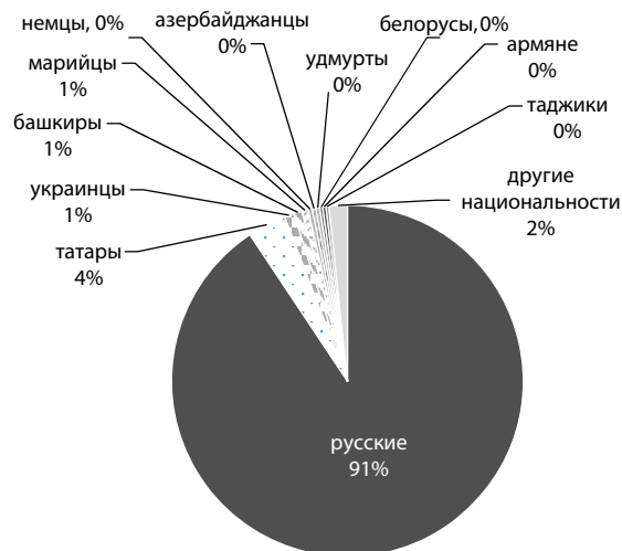
Рис. 1. Наиболее крупные этнические общности Свердловской области

населения, миграционными процессами, но и со сменой этнической идентичности.