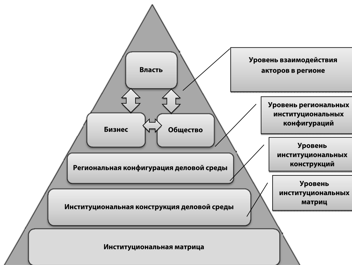
Рис.1 Процесс формирования институтов деловой среды региона

ловия хозяйственной деятельности для различных субъектов, вступающих в хозяйственное взаимодействие.