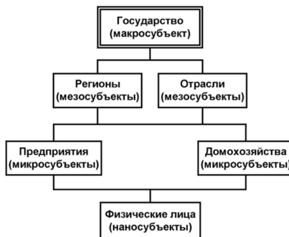
Рис. 1. Основные субъекты экономики

Таким образом, возникает четырехступенчатая «лесенка» субъектов (мировая экономика не включается в рассмотрение в данной работе):