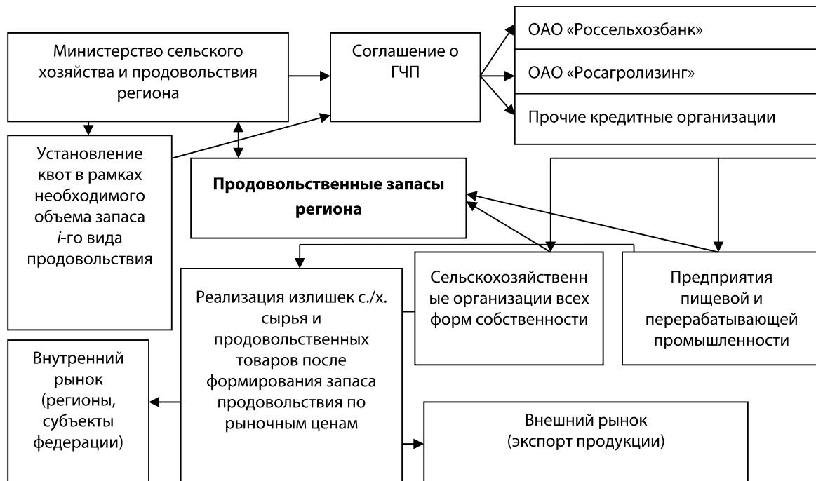
Рис. 2. Организационная модель формирования продовольственных запасов в формате государственно-частного партнерства

(аренду) законсервированных земель, подверженных водной и ветровой эрозии для использования в несельскохозяйственных целях;