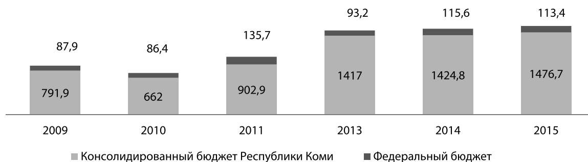
Рис. 2. Объем господдержки реализации Госпрограммы развития сельского хозяйства и регулирования рынков сельскохозяйственной продукции, сырья и продовольствия

молока и говядины. Нет существенных сдвигов в повышении уровня жизни крестьян.