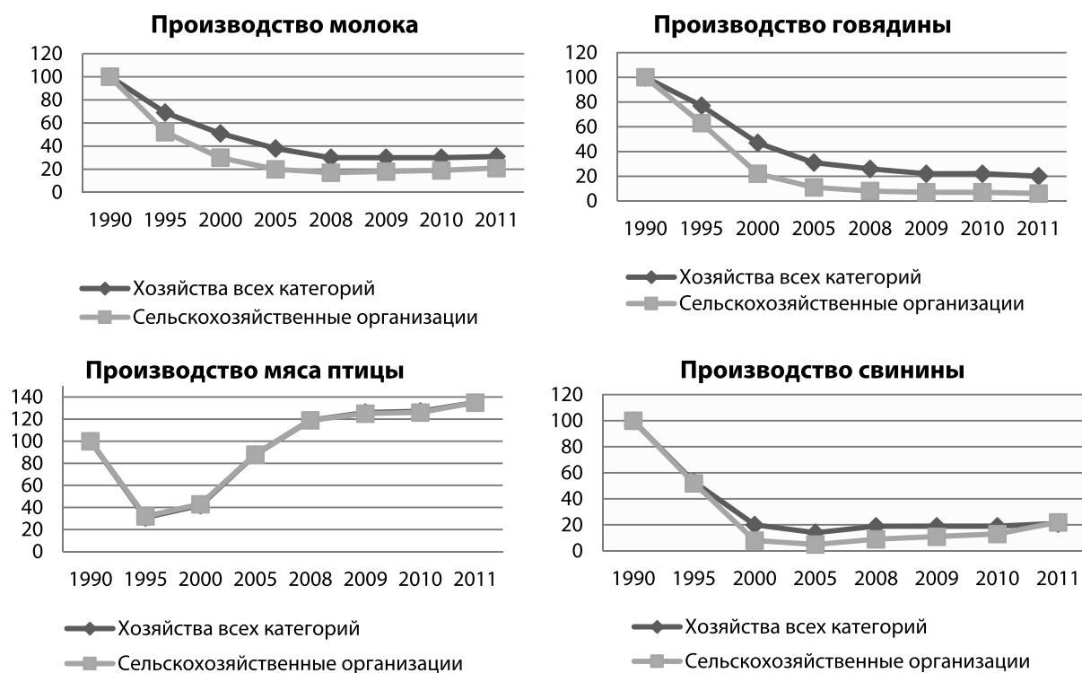
Рис. 1. Динамика производства продукции животноводства в Республике Коми за 1990–2011 гг. (1990 г. = 100)

С вступлением России в ВТО сельское хозяйство зоны Севера, не преодолев кризисных явлений 1990–2000-х гг., столкнется с новыми проблемами. Революционные рыночные преобразования в аграрном секторе северных и арктических территорий нанесли существенный урон сельскому хозяйству и перерабатывающей промышленности, сопровождались деградацией производственного потенциала, а также крестьянского сообщества. За годы рыночных преобразований в хозяйствах всех категорий в субъектах, территории которых полностью отнесены к районам Крайнего Севера, и приравненных к ним местностей, производство мяса снизилось в 3,3, молока — в 2,5, яиц — в 2,2 раза. Посевные площади сократились с 1055,6 до 324,7 тыс. га, поголовье крупного рогатого скота уменьшилось с 1599,7 до 567,9 тыс. голов, в т. ч. коров — с 603,3 до 241,4, свиней — с 1144,4 до 221,4, оленей — с 2260,3 до 1553 тыс. голов.