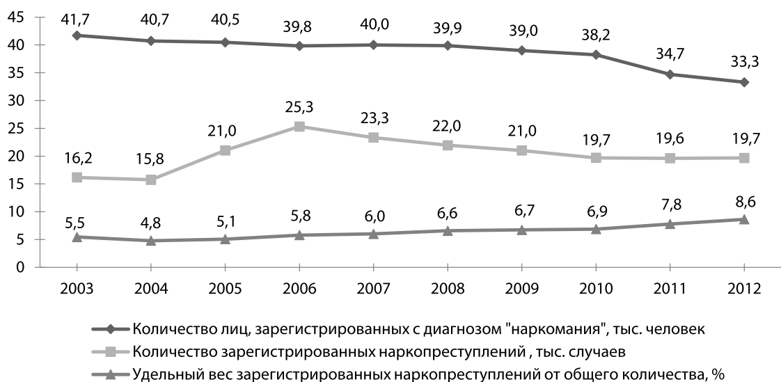
Рис. 1. Количество зарегистрированных больных наркоманией, количество наркопреступлений и их доля в общем числе зарегистрированных преступлений в УрФО за период 2003–2012 гг.

При этом меняется структура лиц, состоящих на наркологическом учете, по-прежнему большинство из них (свыше 92%) составляют потребители опиоидов. Однако наблюдается рост удельного веса лиц, состоящих на учете вследствие потребления различных психостимуляторов.