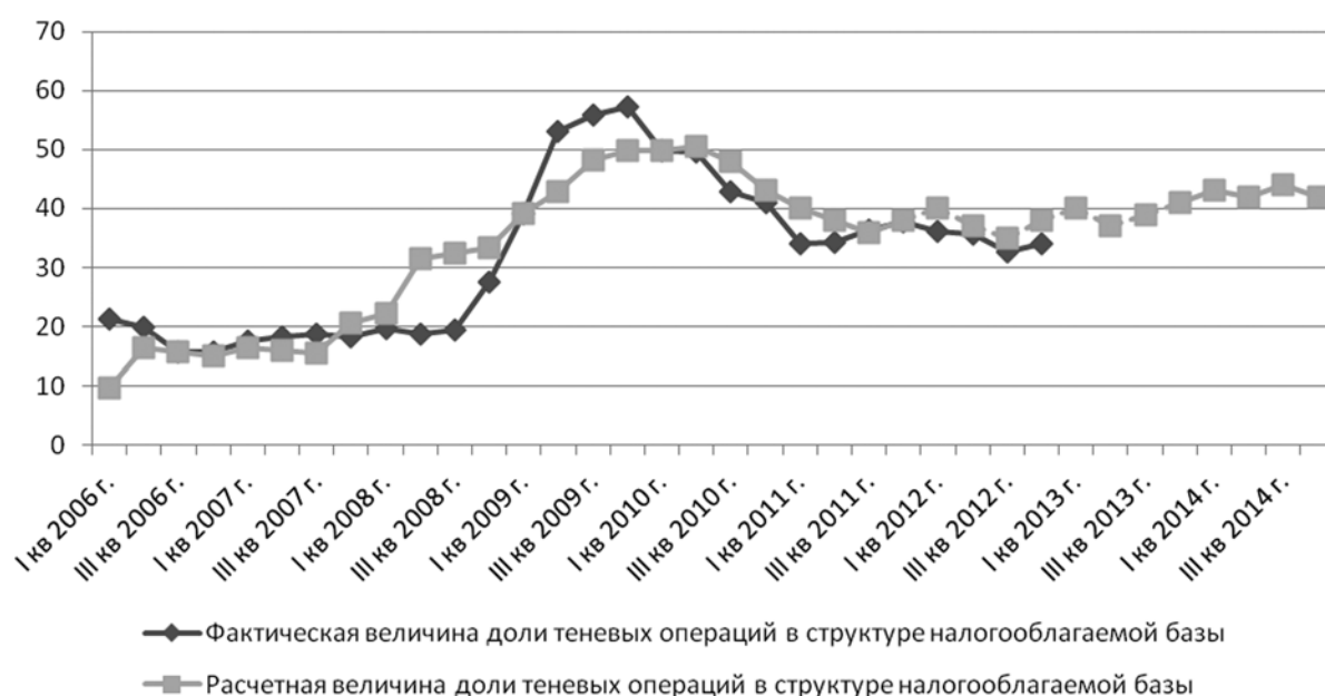
Рис. 2. Сопоставление динамики фактической и расчетной величины объема теневых операций, связанных с уклонением от уплаты налогов, в структуре фактической налогооблагаемой базы (Свердловская область), %

Низкая конкурентоспособность отраслей экономики, проблемы в пенсионной системе РФ, угрозы, связанные с вступлением России