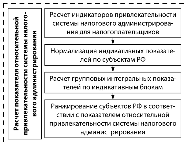
Рис. 1. Общий алгоритм расчета относительной привлекательности системы налогового администрирования региона в соответствии с авторской методикой

зателей и ранжированием субъектов Российской Федерации (общая схема методики представлена на рисунке 1).