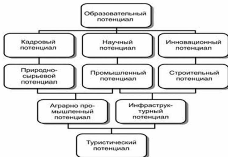
Рис. 2. Потенциал устойчивого развития экономики региона в XXI в.

Должное место займет в данной системе туристический потенциал. Так, например, во