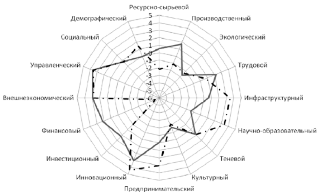
Рис. 2. Реализация адаптивного потенциала Свердловской области в 2006–2007 гг. и в 2008–2009 гг.

предкризисный — 2006–2007 гг. (сплошная линия), и кризисный — 2008–2009 гг. (пунктирная линия). Удаление точек отдельных показателей от центра координатной сетки показывает нарастание значений частных потенциалов, что означает общее увеличение адаптивного потенциала субъекта.