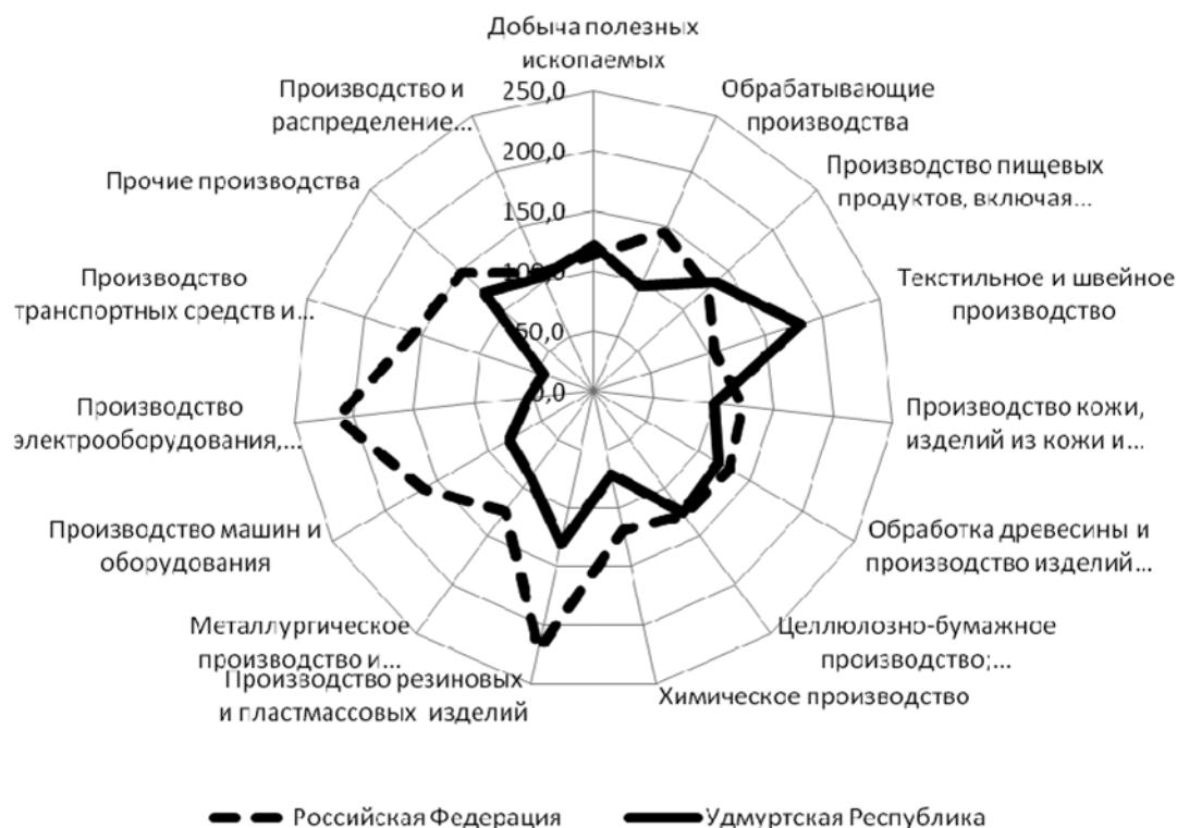
Рис. 1. Индексы промышленного производства в Российской Федерации и в Удмуртской Республике в период 2004–2008 гг., нарастающим итогом, %

Сравнение результатов промышленного развития по основным видам экономической деятельности Российской Федерации и в Удмуртской Республике показывает, что в предкризисный период и в начальный период кризиса наблюдалась определенная рассинхронизация в развитии базовых видов обрабатывающих производств (рис. 1). Особенно