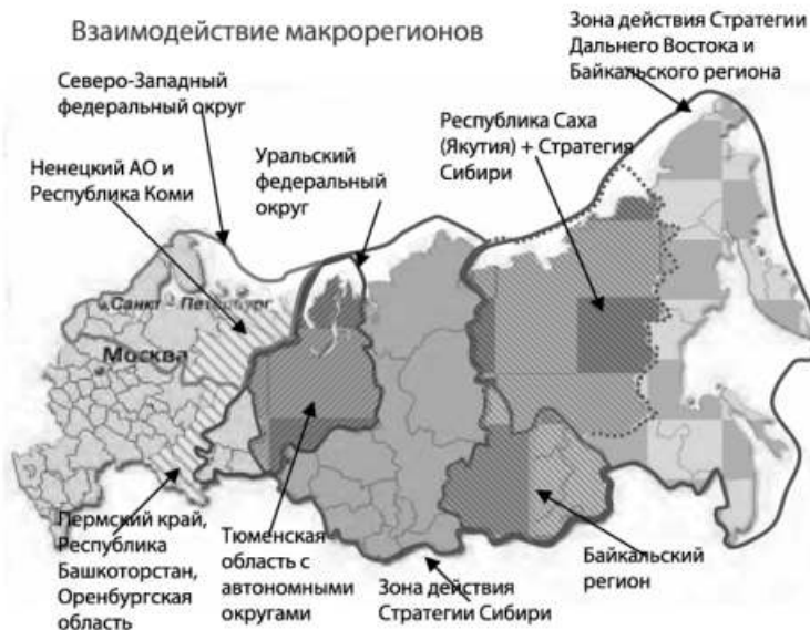
Рис. 3. Взаимодействие макрорегионов

Физическую основу согласования стратегий развития указанных четырех макрорегионов может составить Северо-Российская железнодорожная магистраль (см. рис. 4 — жирной