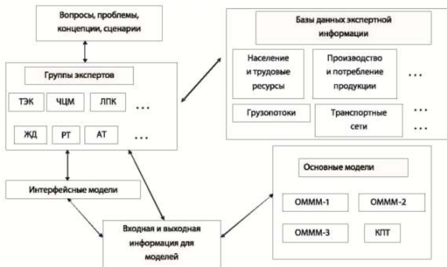
Рис. 2. Организация расчетов стратегического развития страны в целом и (или) ее макрорегионов с использованием комплекса экономико-математических моделей