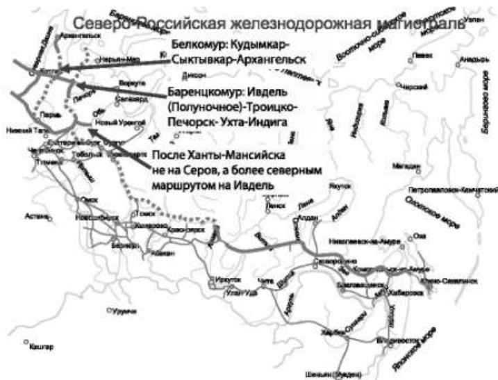
Рис. 4. Северо-Российская железнодорожная магистраль

сплошной линией показаны имеющиеся участки магистрали, жирным пунктиром — те, которые предстоит построить).