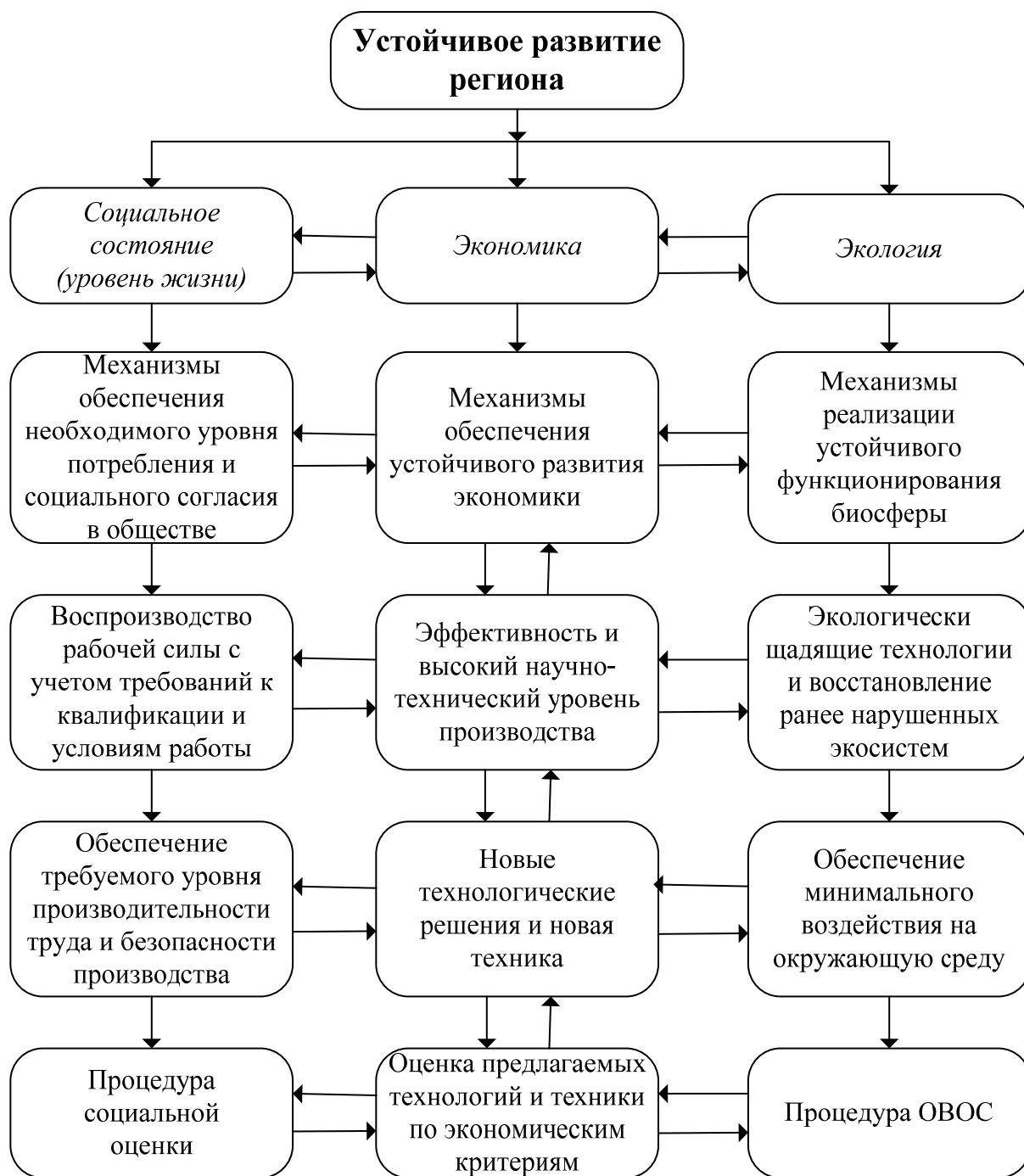
Рис. 2. Блок-схема устойчивого развития региона (по В.С. Селину)

Однако помимо национальных, региональных и муниципальных программ руководители передовой части компаний мира успешно претворяют в жизнь свои мероприятия, направленные на устойчивое развитие собственного бизнеса. Так, например, для включения действующих бизнес-структур в один из авторитетнейших глобальных индикаторов — индекс Доу-Джонса по устойчивому развитию