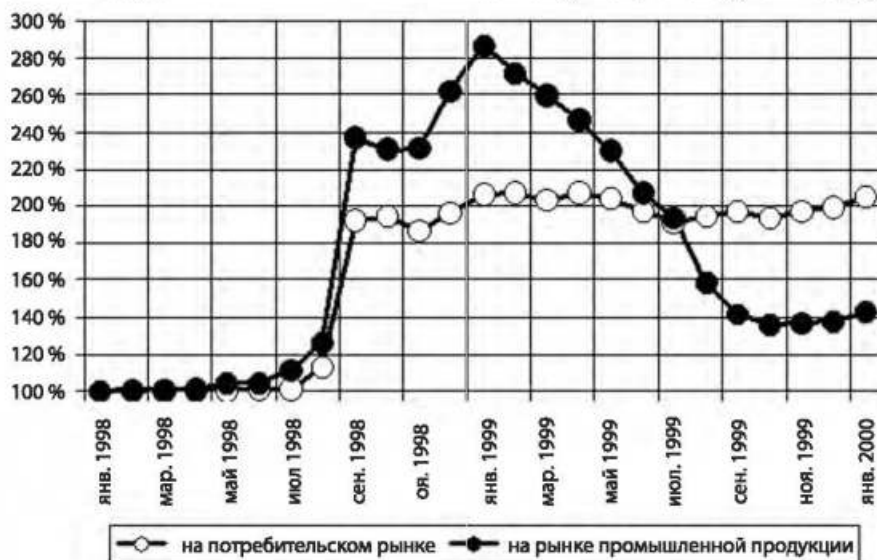
Рис. 2. Изменение покупательной способности доллара США в России, %.

экономики чуть позже стала благоприятная конъюнктура мировых рынков сырьевых ресурсов. Этот источник позволил не только крупному бизнесу, но и государству