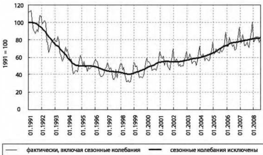
Рис. 3. Индекс хозяйственной активности в промышленности Омской области (на 1 января, % к 1991 г.).

рается на внутренний спрос, поддерживаемый высокими доходами в нефтеперерабатывающем комплексе и стабильными бюджетными расходами, и внутренние ресурсы, обусловленные, помимо прочего, серьезной научно-образовательной базой в виде старейшего аграрного вуза региона и отраслевого академического научно-исследовательского института, что делает ее развитие достаточно устойчивым в рамках региона. Машиностроительный и нефтеперерабатывающий комплексы были сформированы в свое время в соответствии с