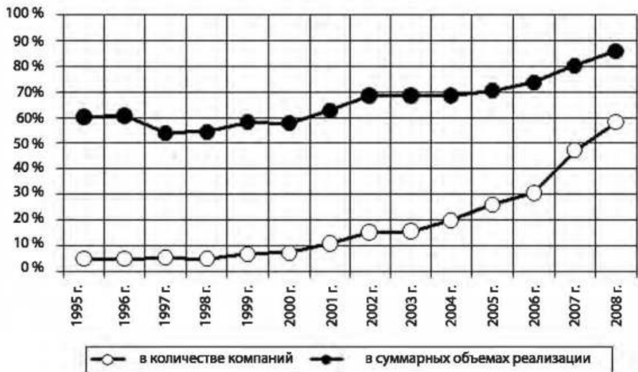
Рис. 1. Удельный вес трансрегиональных компаний в рейтинге 400 «РА Эксперт», % (до 2003 г. — рейтинг 200 промышленных компаний).

Действительно, официальный курс рубля к доллару США с 17 августа по 9 сентября 1998 г. снизился в 3,3 раза, или на 5250% в