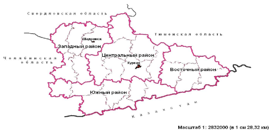
Рис. 4. Районирование Курганской области на основе оценки эколого-экономической устойчивости

В ходе районирования территории Курганской области на основе оценки эколого-экономической устойчивости было выделено 4 района: Центральный, Западный, Восточный и Южный (рис. 4).