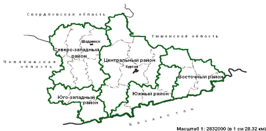
Рис. 1. Районирование Курганской области по комплексу социально-экономических показателей

внутри выделенного социально-экономического района и его территориальной целостности.