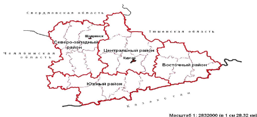
Рис. 6. Комплексное социально-экономическое районирование Курганской области

Северо-Западный район. Отличается наибольшей социально-экономической устойчивостью. Включает 7 муниципальных образований с высоким и средним уровнем социально-экономического развития: Катайский, Далматовский, Шадринский, Щучанский, Шумихинский, Мишкинский районы и город Шадринск.