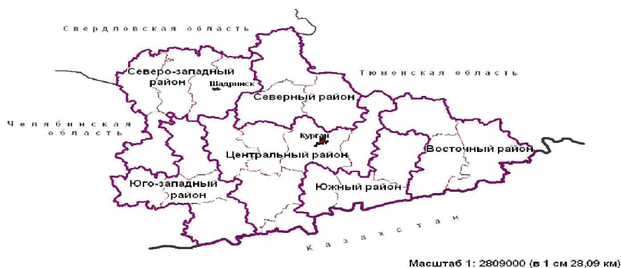
Рис. 5. Районирование Курганской области на основе оценки социально-экономической устойчивости

Выполненная оценка устойчивости социально-экономического состояния Курганской области показала, что самая высокая интегральная оценка получилась у городов Кургана (1340 баллов) и Шадринска (1215 баллов), а также Далматовского (1311 баллов), Мокроусовского (1106 баллов) и Кетовского (965 баллов) районов, а самая низкая – у Альменевского (526 баллов), Лебяжьевого (547 баллов) и Сафакулевского (596 баллов) районов [8]. В целом можно сделать вывод, что большая часть муниципальных образований Курганской области имеют средний и низкий уровень социально-экономической устойчивости. На основе ранжирования муниципальных образований по уровню социально-экономической устойчивости было проведено районирование и выделены 6 районов: Северо-Западный, Северный, Юго-Западный, Центральный, Восточный и Южный (рис. 5).