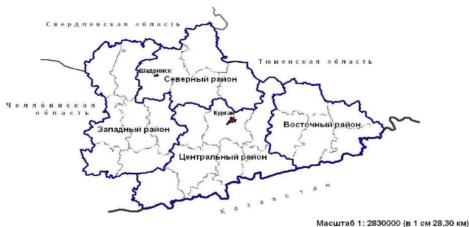
Рис. 2. Районирование Курганской области по индексу развития человеческого потенциала (ИРЧП)

данного исследования. Официальная методика подсчета ИРЧП не применяется к муниципальному уровню, поэтому за основу были взяты опубликованные данные по корректировке официальной методики и приспособлению ее для подсчета ИРЧП по муниципальным образованиям Курганской области [5]. По данному интегральному показателю была построена карта и выделены районы с однородным ИРЧП (рис. 2). Для удобства анализа по каждой составляющей ИРЧП также были созданы карты, отражающие их пространственное распределение. Ранжирование территории Курганской области на основе ИРЧП позволило осуществить районирование и выделить 4 района: Северный, Западный, Восточный и Центральный.