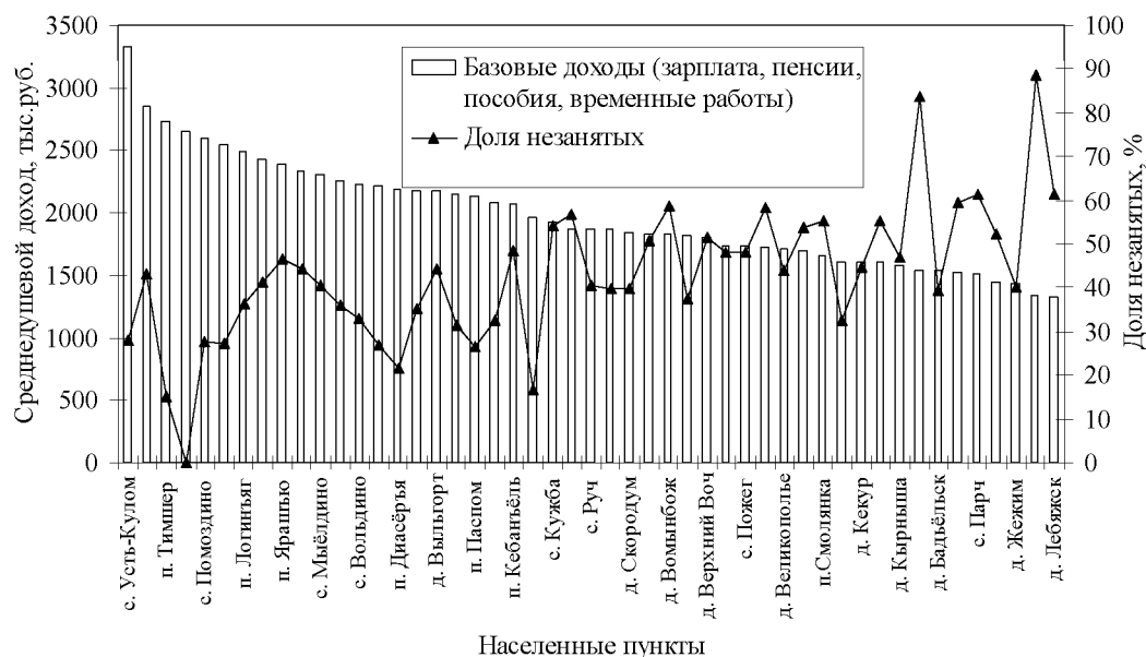
Рис. 1. Среднедушевые доходы и уровень безработицы в населенных пунктах агропромышленного района

условия работы и жизни как в районе проживания, так и за его пределами. Особенно острая ситуация складывается в традиционных селах и деревнях, где полностью ликвидировано организованное сельское хозяйство. Именно здесь наблюдаются самые высокие показатели фактической безработицы.