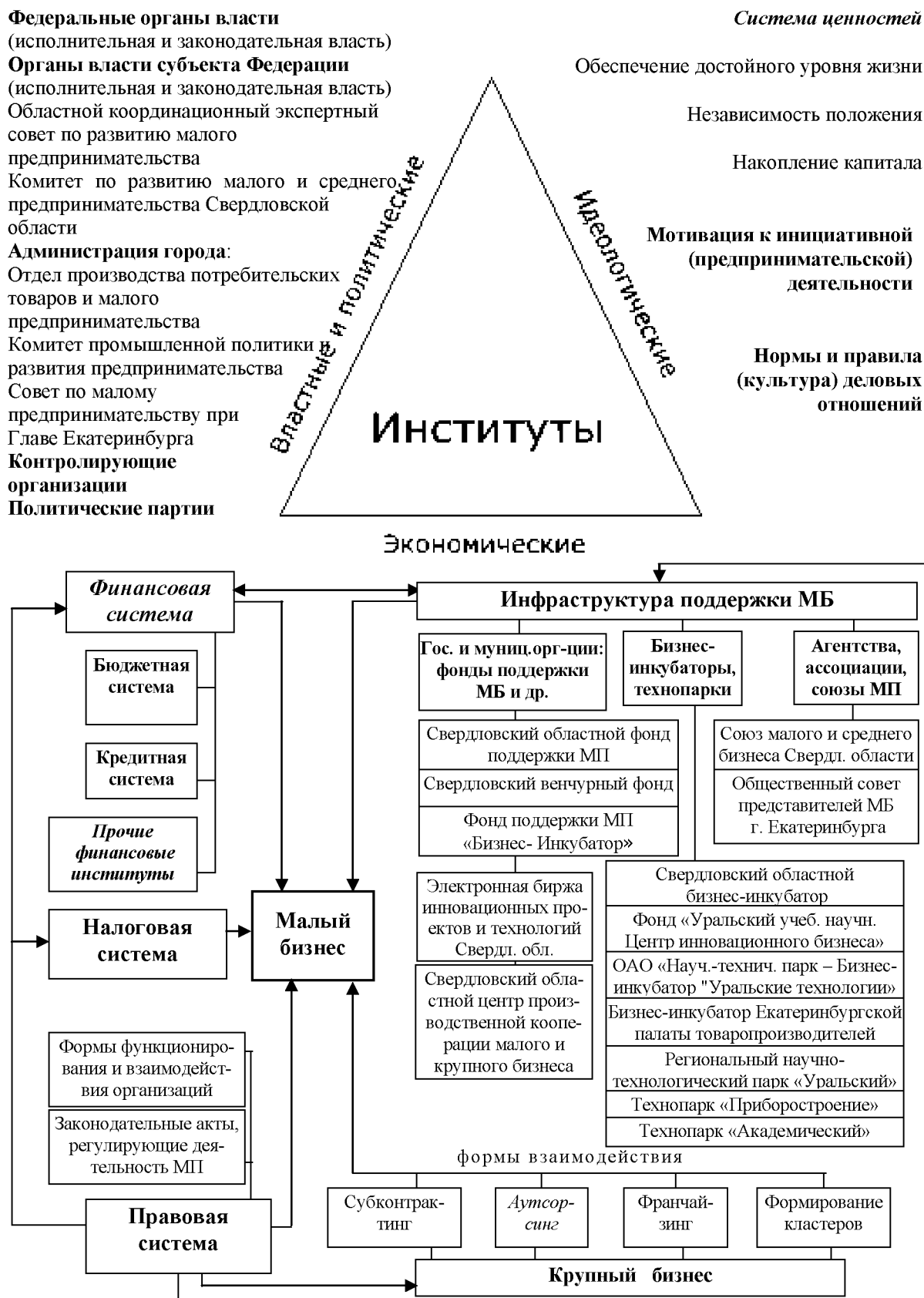
Рис. 1. Институциональный контур функционирования и развития инновационного малого бизнеса МО г. Екатеринбург