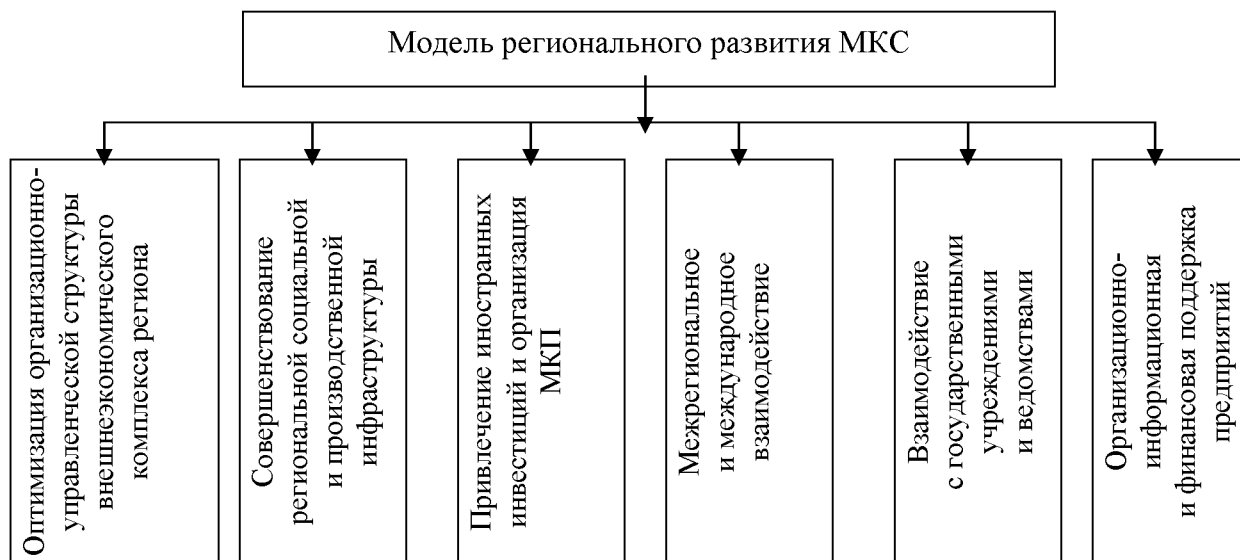
Рис. 2. Концептуальная модель обеспечения МКС на региональном уровне

В Самарской области разработан и внедряется проект "Стратегии социально-экономического развития на период до 2020 года.