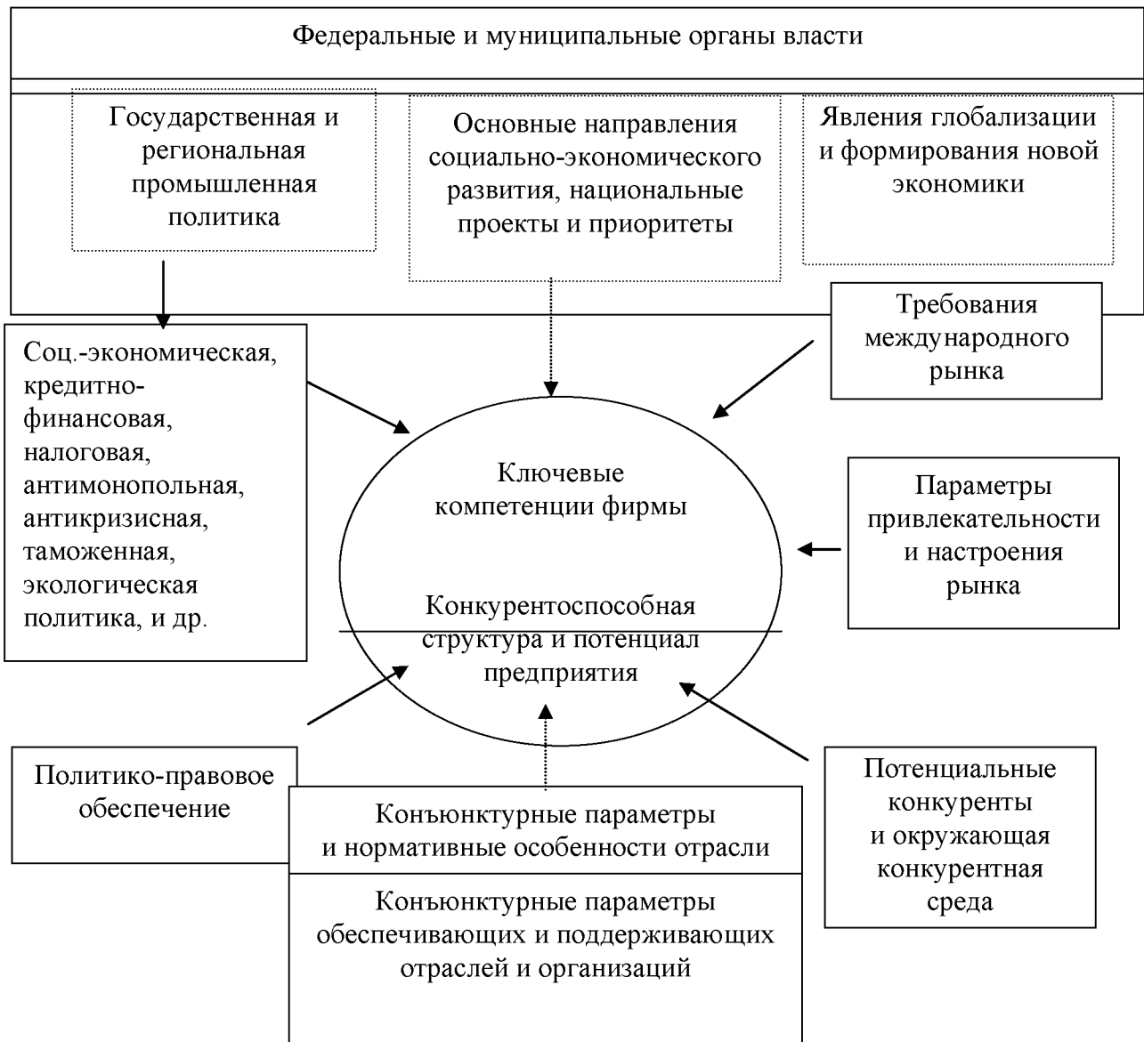
Рис. 1. Системные характеристики управления конкурентоспособностью в масштабах отдельно взятой страны

В этой связи процессы формирования государственно-частного партнерства, инициируемые Правительством РФ, выглядят достаточно своевременными. Выражается это, прежде всего, в законах по соглашениям о разделе продукции, концессионных соглашениях, размещении заказов для государственных и муниципальных нужд. Созданы такие важнейшие институциональные механизмы, как федеральный Инвестиционный фонд, Российская венчурная компания, три типа особых экономических зон. Опыт показывает, что среди важнейших факторов успеха непременно должна быть не только высокая заинтересованность субъектов бизнеса в экономическом росте, но и политическая воля и сбалансированность интересов органов власти.