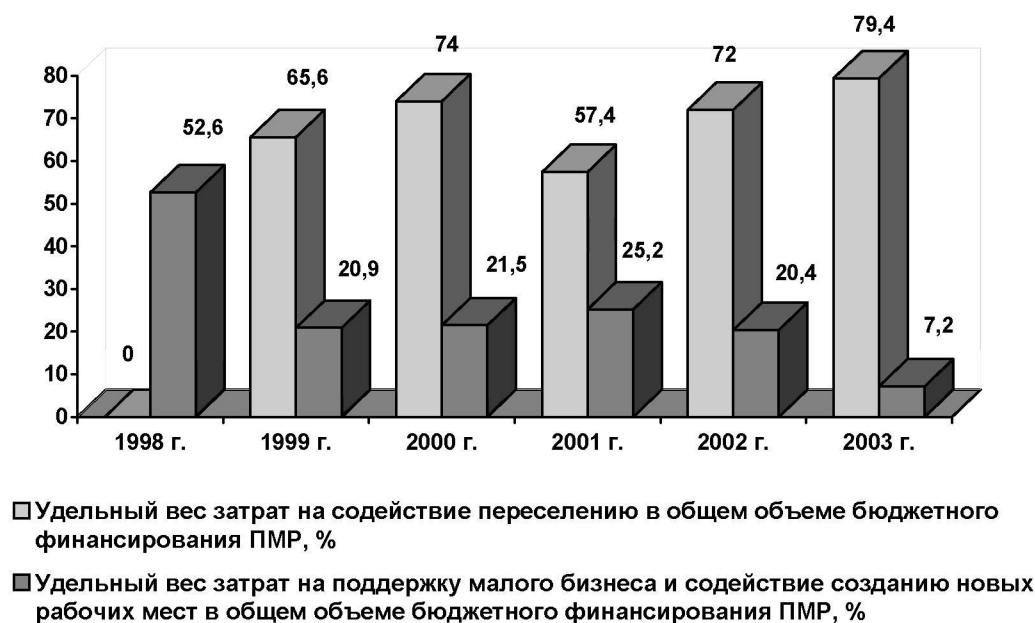
Рис. 1. Динамика реализации основных направлений программ местного развития и обеспечения занятости по Кизеловскому угольному бассейну за период 1998-2003 гг.

руктурируемой отрасли, но и приносит посредством налоговых поступлений доход в местный бюджет. Сравнительная оценка стоимости государственной поддержки высвобожденных работников угольной отрасли по основным направлениям программ местного развития за 1998 – 2003 гг. представлена на рисунке 2.