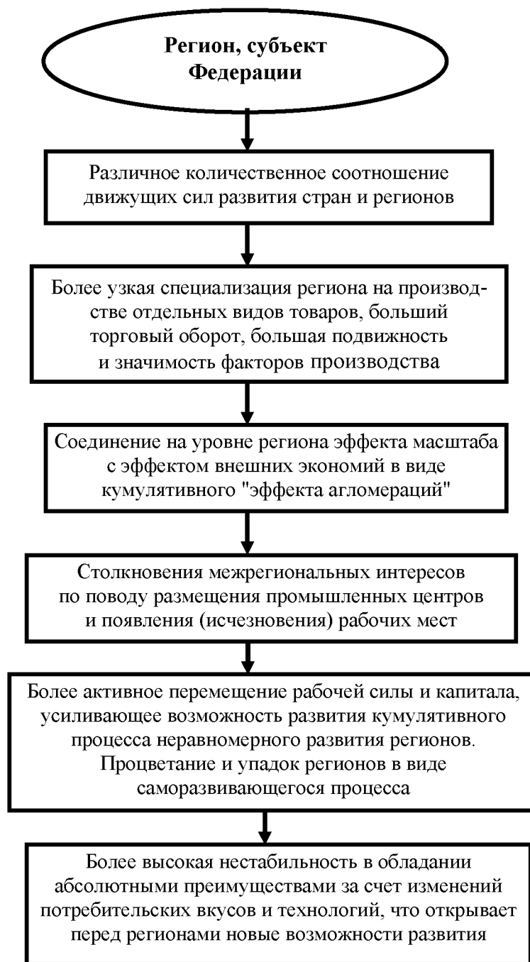
Рис. 3. Отличительные особенности региона как носителя конкурентных преимуществ

Бесспорно, что экономика каждого региона уязвима такими глобальными факторами, как международная конкуренция, традиционные циклические межстрановые и региональные кризисы. Указанные факторы можно назвать общими факторами первого порядка. К ним следует добавить факторы специфические, обусловленные национально-историческими и общественно-экономическими особенностями конкретной страны. Так, общими практически для всех субъектов Российской Федерации являются такие