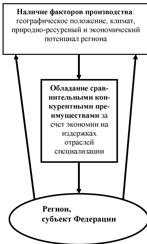
Рис. 2. Факторы производства и сравнительные конкурентные преимущества региона

Основные дефиниции теории сравнительных конкурентных преимуществ, бесспорно, применимы к уровню регионов. Во-первых, регионы различаются по климату, ресурсам и технологиям и специализируются на тех товарах, которые делают эффективнее. Сравнительные конкурентные преимущества региона – это те ресурсы (факторы производства), которые регион имеет в изобилии (капитал, труд, земля). Это потенциал региона.