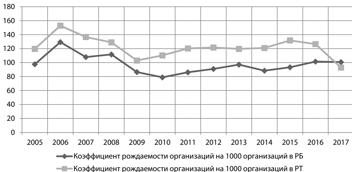
Рис. 3. Сопоставление профилей динамики рождаемости организаций в Республике Башкортостан и Республике Татарстан