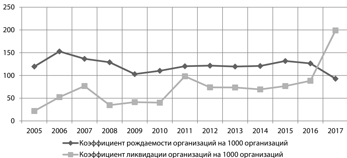
Рис. 2. Профиль динамики демографии организаций в Республике Татарстан