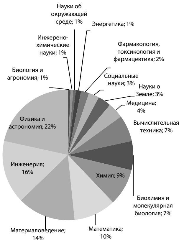
Рис. 2. Сфера научных интересов ученых, выбравших продолжение научной карьеры за рубежом

ственно практическое значение, либо быстро находят внедрение — таких как инжиниринг, вычислительная техника, материаловедение. О востребованности российских ученых в направлениях науки, дающих быстрый экономический рост, говорит и то, что часть ученых, сохранив публикационную активность, продолжили научно-практическую деятельность не