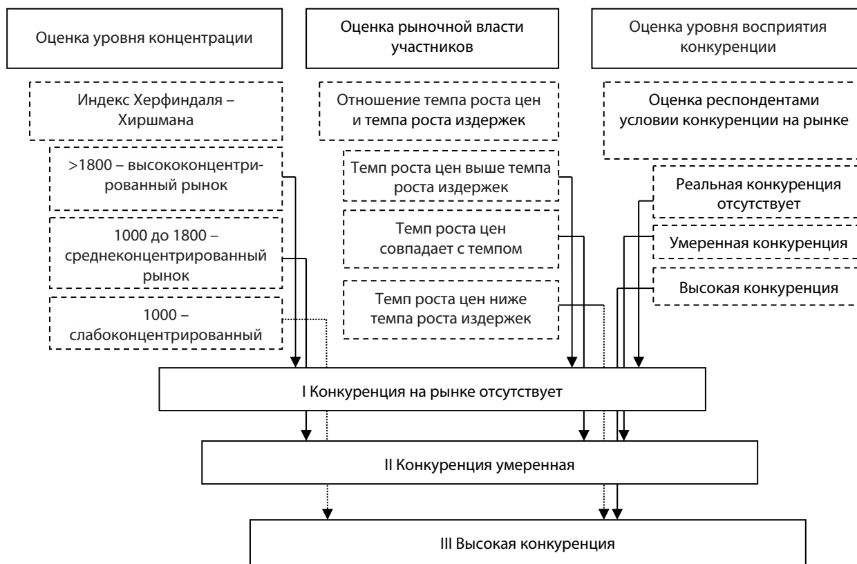
Рис. 1. Модель сопоставления оценок сформированности конкурентной среды

Опросные методы имеют также организационные преимущества оценки сформированности и динамики конкурентной среды. Объемы работ по сбору информации выполняются самими участниками рынков, которые выполняют их на регулярной основе, с использованием разнообразных источников.