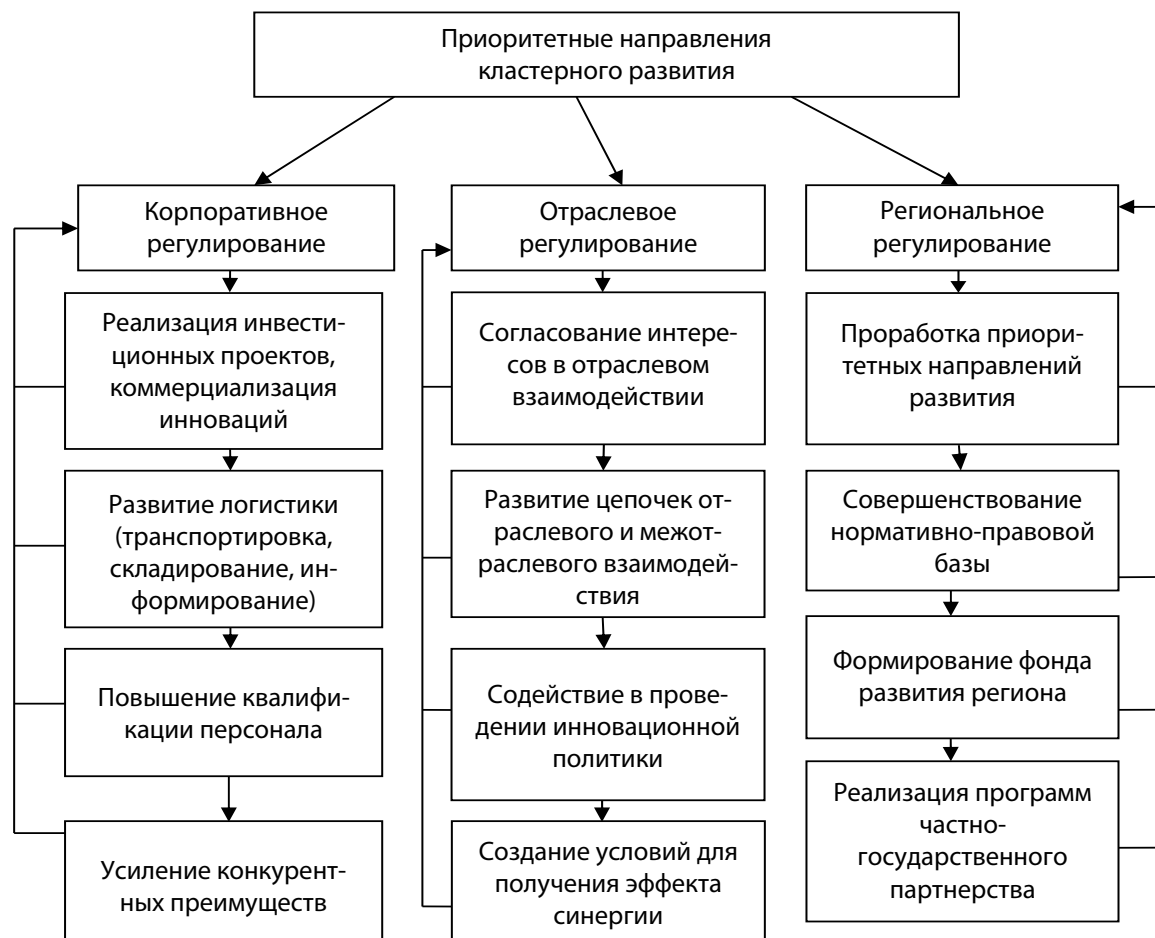
Рис. 1. Комплексный подход кластерной интеграции на примере Ульяновской области

необходимо соблюдать следующий алгоритм: «Каждый руководитель компании поставит перед собой определенную цель, при этом каждое подразделение решает отдельные задачи для достижения общей цели компании» [16].