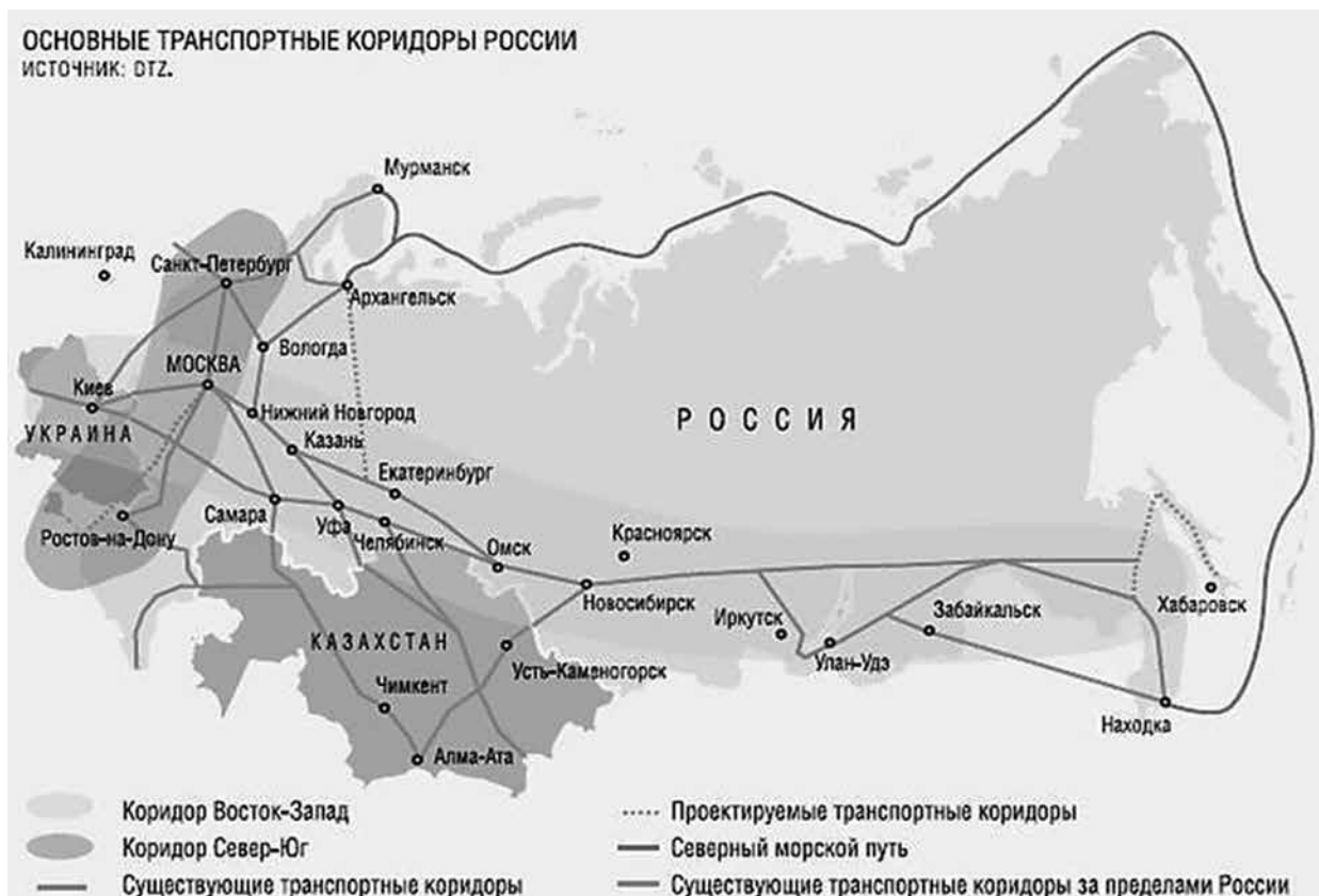
Рис. 1. Распределение логистических транспортных коридоров на территории России [2]

маркетинговых параметров используются конкурентные, демографические, рыночные и др. [3].