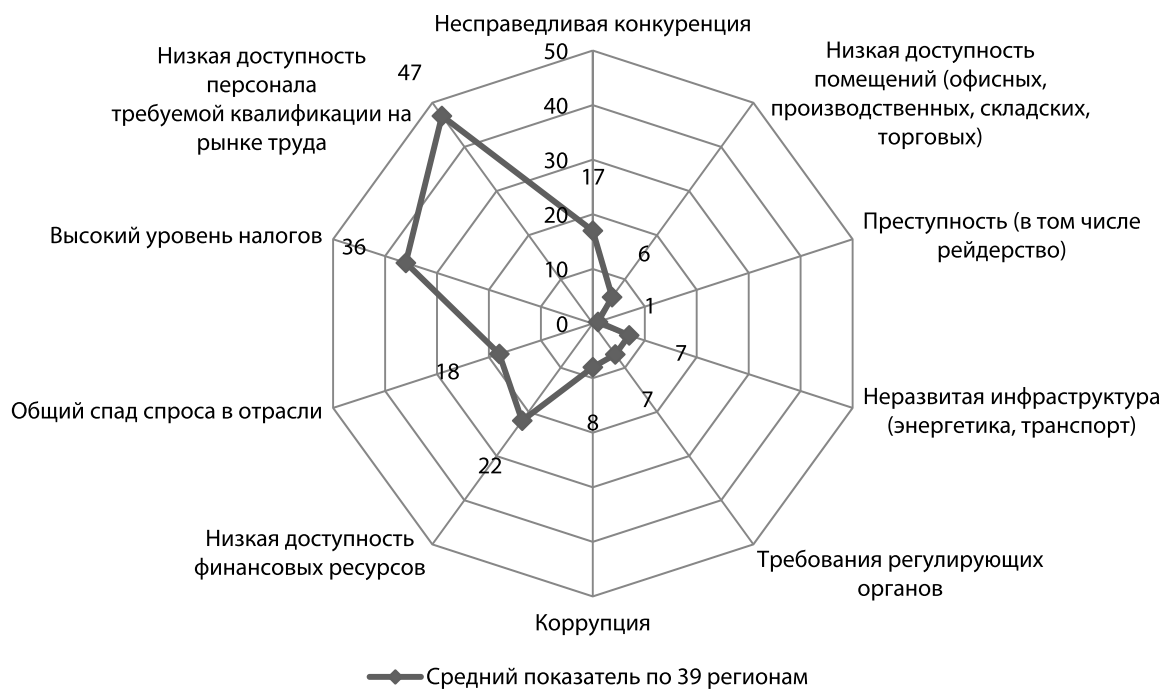
Рис. 1. Препятствия для развития малого и среднего предпринимательства в Российской Федерации (% от числа опрошенных предпринимателей)

аппарат и муниципальные структуры обладают достаточно внушительными регулятивными возможностями относительно бизнеса, позволяющими воздействовать на хозяйствующие субъекты. В таких условиях среда функционирования субъектов малого и среднего предпринимательства продолжает оставаться непрогнозируемой, что, естественно, не дает предпринимателям возможности со стопроцентной уверенностью планировать будущее своего бизнеса. Более того, последние решения государства по вопросам регулирования предпринимательской деятельности на фоне декларации необходимости снижения административного бремени на бизнес воспринимаются как свидетельство противоречивости и даже «неуклюжести» государственной политики в сфере малого и среднего предпринимательства. Это подтверждают такие нововведения в сфере административного регулирования, как дробление единого социального налога на несколько взносов во внебюджетные фонды с одновременным увеличением размера общей ставки, введение обязательности бухгалтерского учета для «упрощенцев», резкое повышение для ИП фиксированных социальных платежей в пенсионный фонд и фонд обязательного медицинского страхования, распространение порядка ведения кассовых операций на индивидуальных предпринимателей.