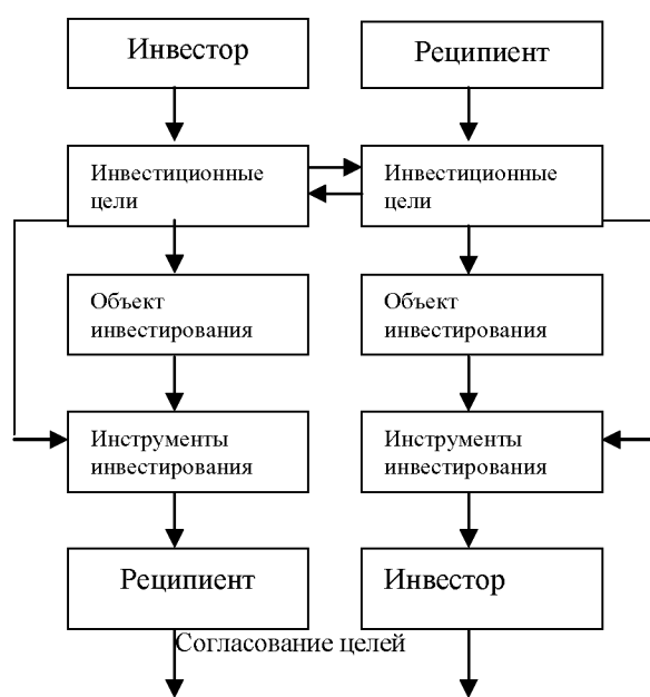
Рис. 2. Процедура выбора инвестиционных инструментов

Прежде всего, необходимо отметить, что, как правило, стороны инвестиционной сделки стремятся в первую очередь согласовать не круг применяемых инвестиционных инструментов, а прочие существенные условия инвестиционной сделки. Данный подход достаточно широко распространен в деловой практике и в определенных ситуациях может быть оправдан, но его реализация требует достаточно существенных временных затрат и переговорных усилий между сторонами, поскольку выбор того или иного инструмента финансирования инвестиционной сделки сам по себе напрямую влияет на условия, которые рассматриваются сторонами сделки как существенные. В качестве альтернативного подхода нами предлагается следующая последовательность действий при выборе инвестиционных инструментов (рис. 2):